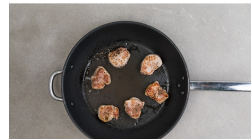
3. Fleisch braten

Die Karotten , den Lauch und das Fleisch in die Sauce geben und alles 5-8Min. köcheln lassen, bis das Gemüse bissfest und das Fleisch durch ist. Mit dem restlichen Brühwürz nach Geschmack sowie Salz und Pfeffer abschmecken und die Petersilie unterheben.