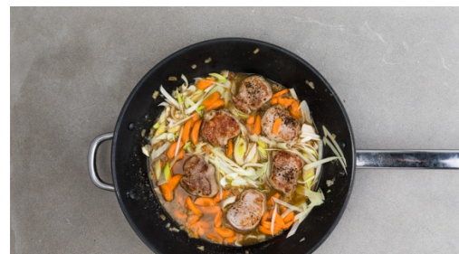
5. Sauce fertigstellen

Das Fleisch trocken tupfen, von ggf. vorhandenen Sehnen befreien und quer zur Faser in ca. 2cm dicke Medallions schneiden.