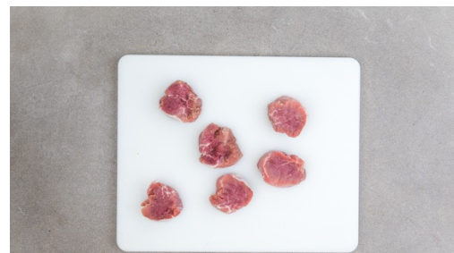
2. Fleisch schneiden

Die Zwiebeln in derselben Pfanne bei mittlerer Hitze 1-2Min. glasig anschwitzen, dann 1EL Mehl hinzufügen und unterrühren. Mit 300ml Wasser und der Crème fraîche ablöschen und die ½ des Brühwürzes unterrühren.