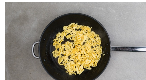
6. Spätzle anbraten

Das Fleisch mit Salz und Pfeffer würzen und in einer großen Pfanne mit 1EL Pflanzenöl bei mittlerer Hitze auf jeder Seite 1-2Min. anbraten. Aus der Pfanne nehmen und auf einem Teller beiseitestellen. Die Pfanne nicht auswaschen.